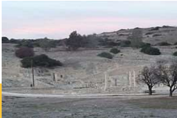
Αρχαιολογικός χώρος Αμαθούντα